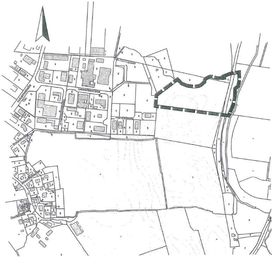
Geltungsbereich der 19. Änderung des Flächennutzungsplanes