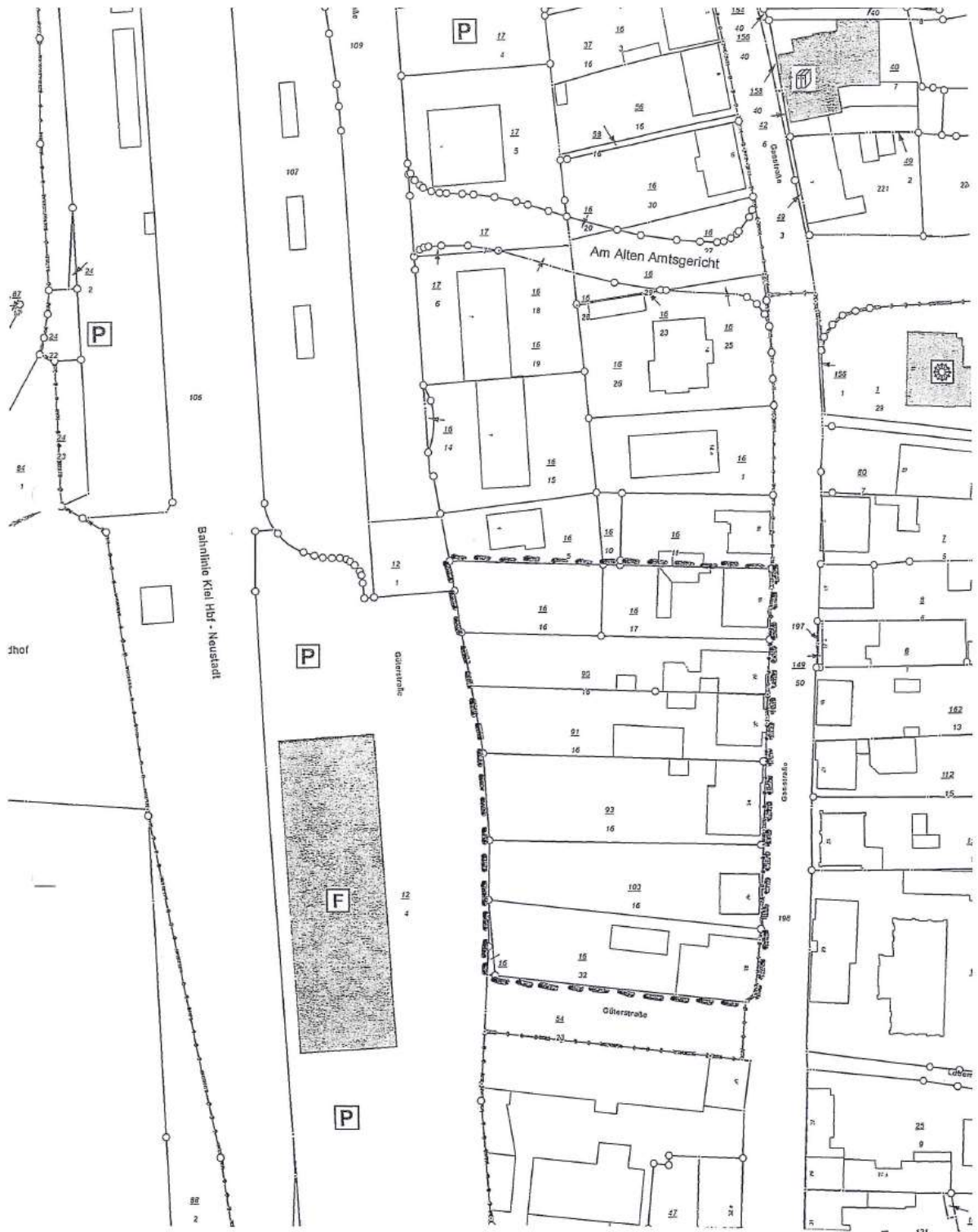
Geltungsbereich der 2. Änderung des Bebauungsplanes Nr. 59 A